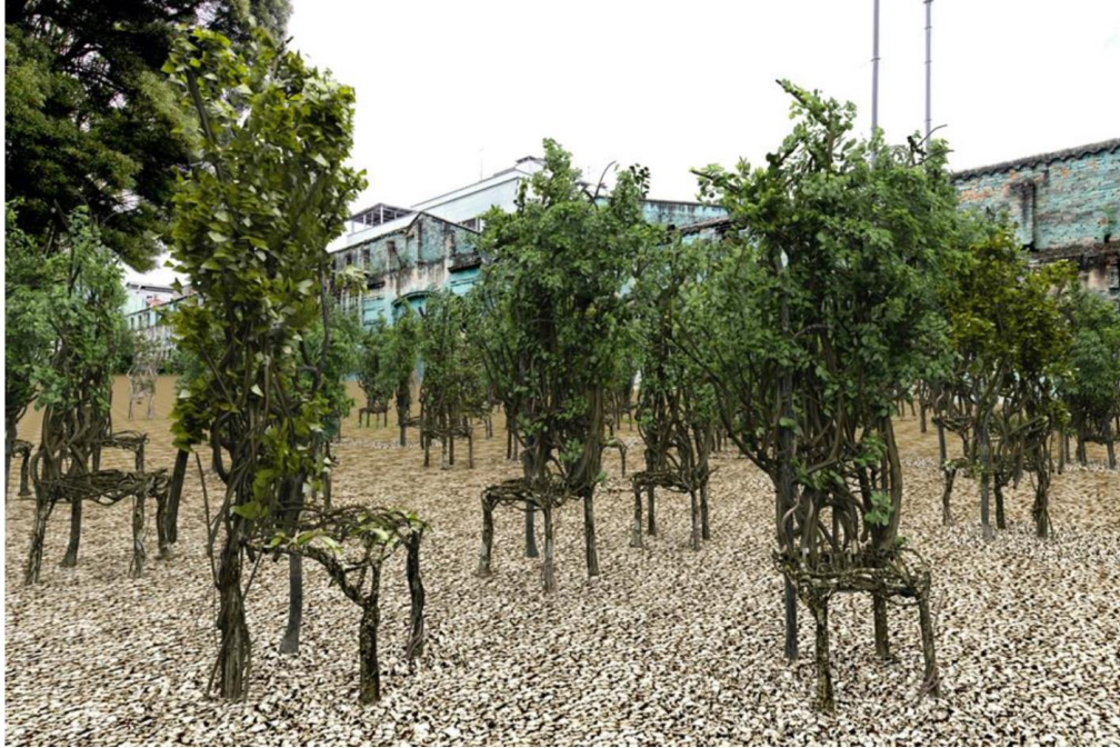
Ilustración 1 Render, vista parcial de El Bosque de los Ausentes