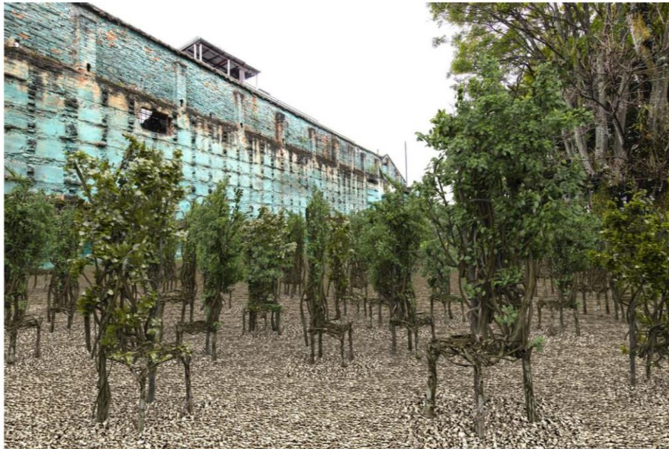
Ilustración 2 Render vista parcial

La obra El Bosque de los Ausentes proporciona un lugar en este mundo, para aquellos seres a quienes se les truncó violenta e injustamente la posibilidad de existir en él.