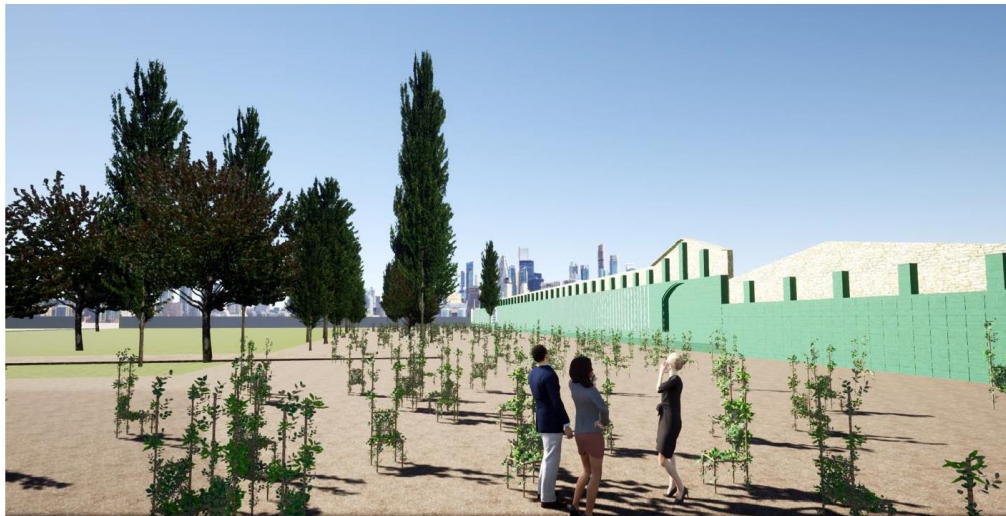
Ilustración 3 Render de la obra recién sembrada