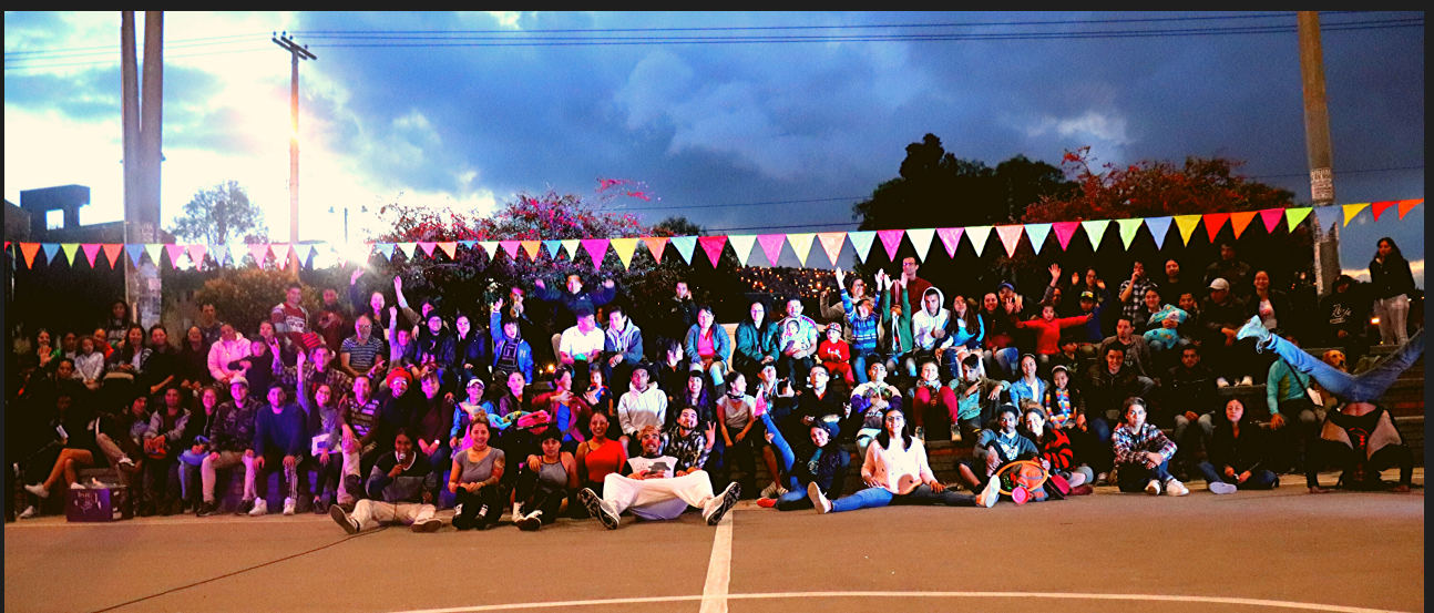
Parque Casa Linda 05 de Noviembre