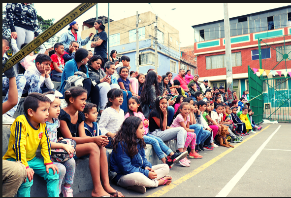
Parque la Virgen Morena - 31 de agosto