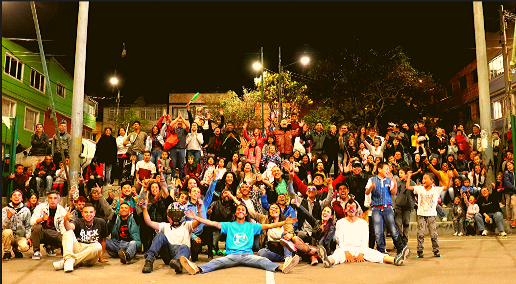
Parque Jamaica 02 de Octubre